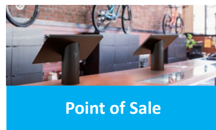
Point of Sale